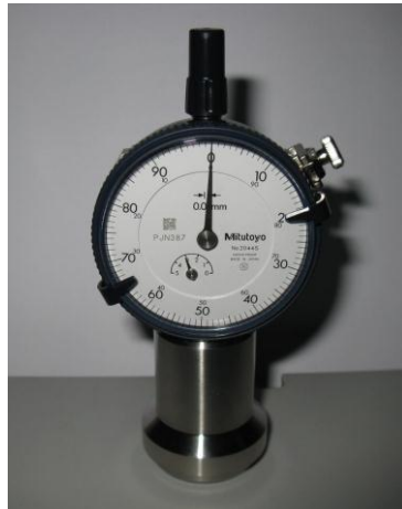
图 2: 校正方法