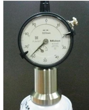
图 3: 使用方法