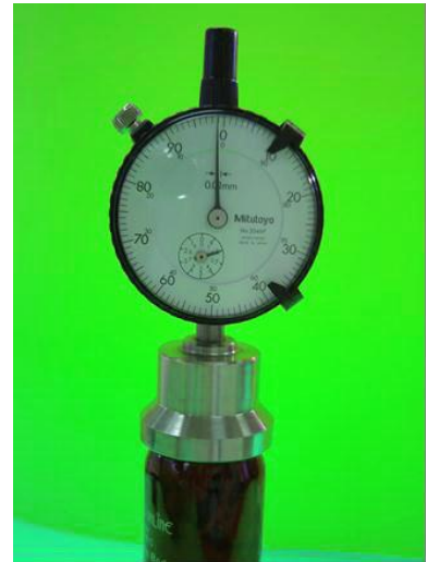
图 3: 使用方法