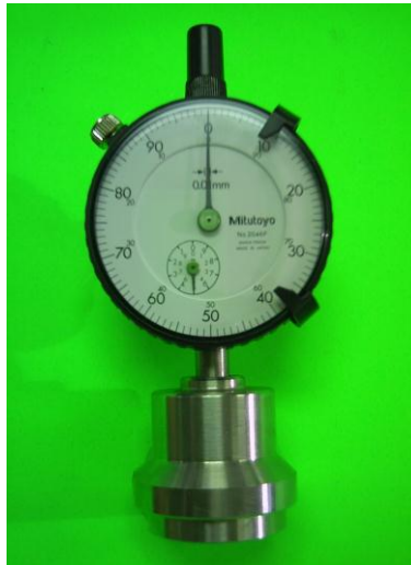
图 2: 校正方法